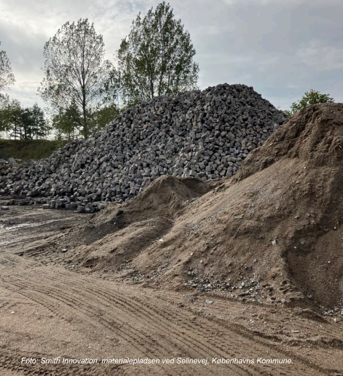
materialepladsen ved Selinevej, Københavns Kommune.