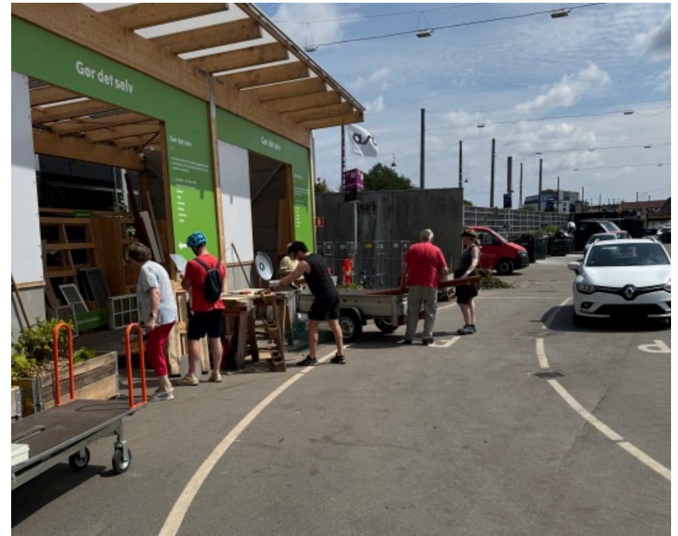
Et par kommer med trailer og afleverer rør i metal mens andre kommer direkte fra cyklerne og skærer noget træ til.

Personalet fortæller, at andre genbrugsstationer har afprøvet muligheden for at låne ladcykler, men at der var forskellige problemer med at finde et velfungerende pantsystem eller sikkerhed.