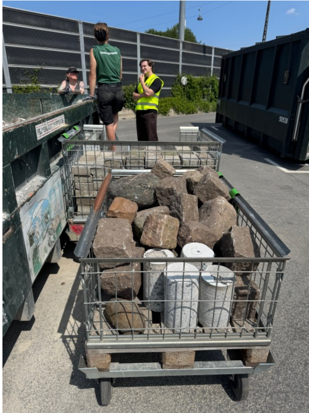
På mindre travle dage bruger personalet gerne tid på at flytte materialer, som har været smidt ud hen til genbrugsområdet. Her er det forskellige sten og betonfliser.