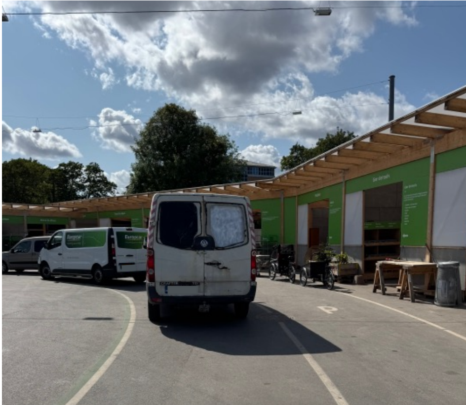
En rumænsk varevogn bliver fyldt torsdag eftermiddag. Foran denne holder en lejet varevogn.