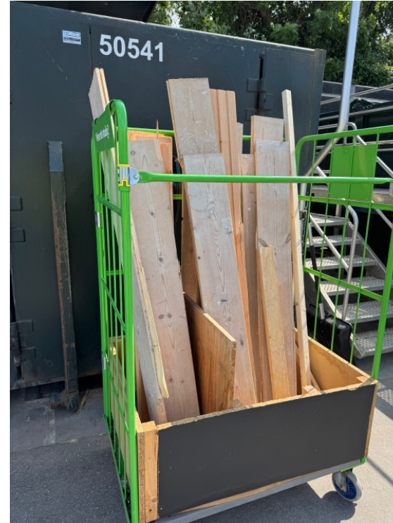
Brædder som endnu ikke er flyttet til genbrugsområdet. Brugere kan være usikre på om de må tage herfra.

På den anden side kan det ses som en udfordring, at mange brugere går forgæves. Personalet fortæller at de meget gerne vil hjælpe brugerne med at finde de materialer de skal bruge. Kun få af de interviewede vidste dog, at de kunne spørge personalet om materialer, som måske er i nogle andre containere og ikke flyttet over til genbrugsområdet endnu.