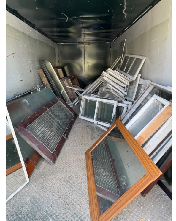
Et billede fra containeren med vinduer. Kan det endnu flere herfra komme over i genbrugssektionen?