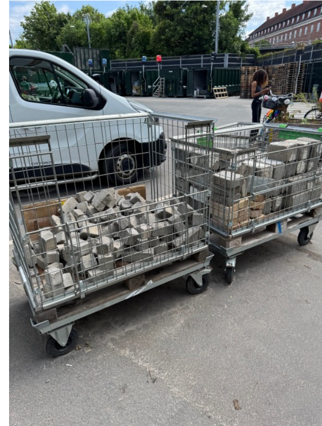
Sten fra billedet til venstre hentes ved genbrugsområdet. Flere af disse blev hentet af brugere senere på ugen.